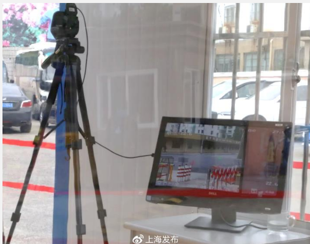
▲学校入口の対応観測器