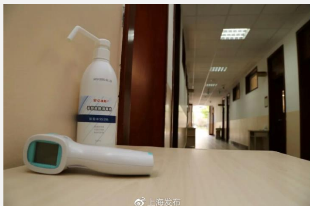
▲教室入口の体温測定器と消毒液