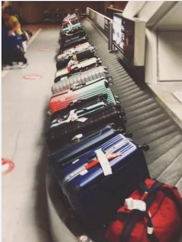
整理されているスーツケース