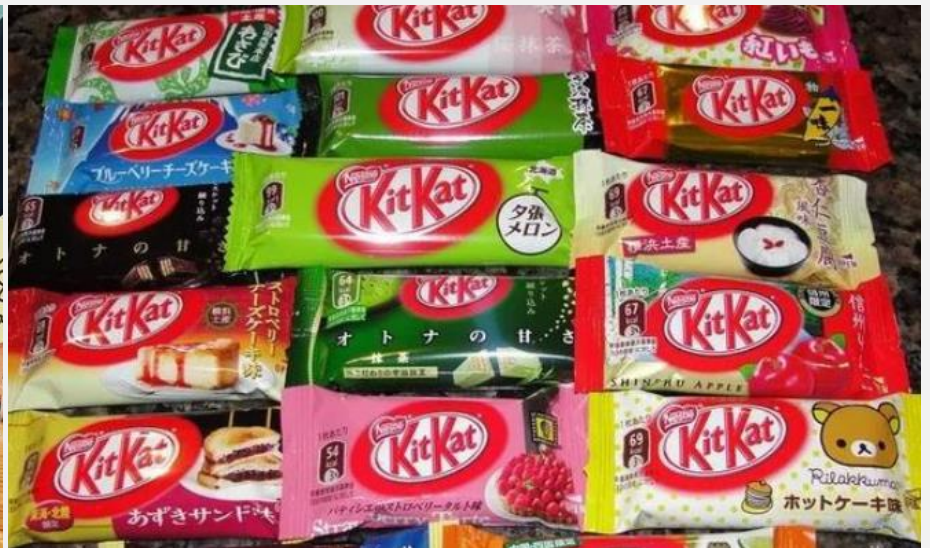
同じ商人だが、たくさんの味がある