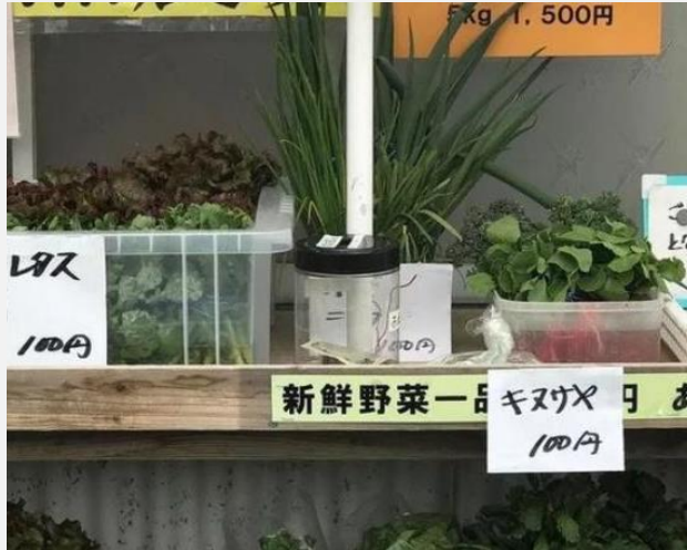
無人売り場の現金入り缶