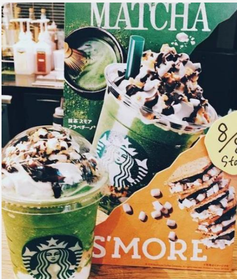
サンプルと実物が全く同じ